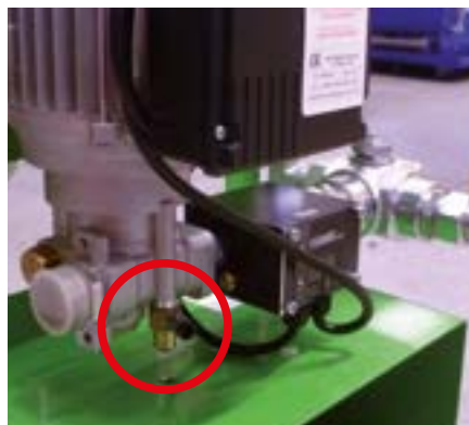
Système de purge pour amorçage pompe