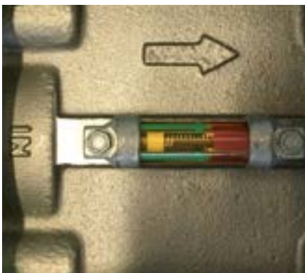
Indicateur de colmatage.