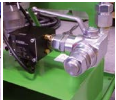
Vanne 3 voies pour vidange ou filtration